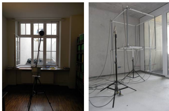
Abbildung 2: Messungen im Innenraum (I.) mit einer Mikrofon-Schwenkanlage 360°/60s (links) und (II.) mit einem 8-Mikrofon-Würfel 1m 3 in Raummitte (rechts)

Mit zwei unterschiedlichen Messkonfigurationen wurden jeweils drei verschiedene Wohnräume mit konventionellen Bauteilen (Fenster SSK3) gemessen.